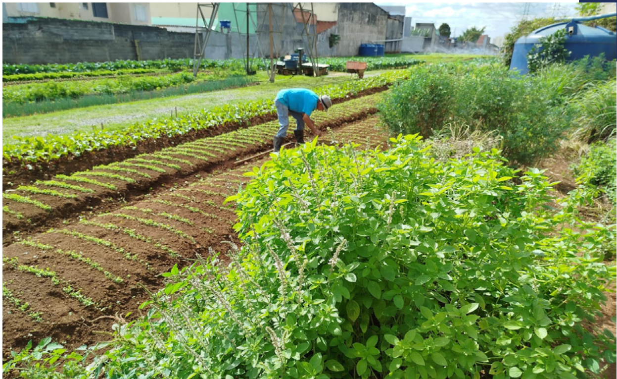
Horta urbana em São Mateus (zona leste da cidade de São Paulo) (2024).

Hortas urbanas são áreas de horticultura, geralmente implantadas em áreas degradadas, abandonadas ou subutilizadas localizadas em cidades. Nestas áreas, a implantação de hortas demanda atenção para solucionar eventuais problemas de contaminação de solos, que frequentemente representam riscos à saúde humana. A CSF implementa hortas de diferentes tamanhos (entre 3 e 10 mil m 2 ), com prevalência das intervenções menores, de 3 mil m 2 - a avaliação da doebem tomou por referência os custos para a horta mais prevalente. Estas hortas têm um custo líquido de implementação médio de R$ 295 mil diluído ao longo de três anos, tempo necessário para que a horta alcance seu ponto de viragem para autossuficiência.