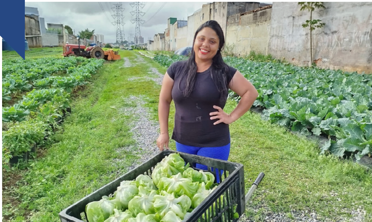
Beneficiária de horta urbana com sua produção de hortaliças.

Na avaliação, a CSF satisfaz a maioria destes aspectos, com destaque para a solidez institucional da organização e para o mecanismo de geração de renda da intervenção. Como ponto de atenção, destacamos que, embora possa melhorar o acesso à alimentação, a geração de renda sozinha não produz o melhor impacto direto sobre a insegurança alimentar. Além disso, é importante compreender se, e quanto da renda gerada nas hortas é utilizada para a aquisição de alimentos saudáveis em detrimento dos ultraprocessados, cujo consumo corresponde a formas moderadas e leves de insegurança alimentar. Outros pontos de atenção acerca da clareza do conteúdo disponibilizado nos canais de comunicação da OSC foram identificados durante a avaliação. Quando da formalização da parceria, a organização se comprometeu a realizar melhorias pontuais em seu site para comunicação com os doadores, e ampliar a transparência em sua prestação de contas, assegurando à doebem e aos seus doadores que esta é uma recomendação sólida.